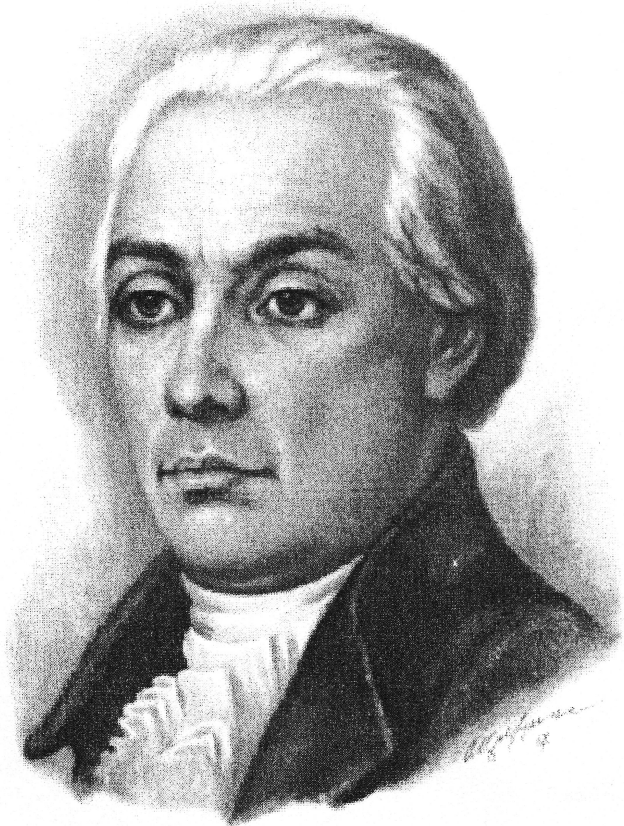
Александр Николаевич Радищев (1749–1802)