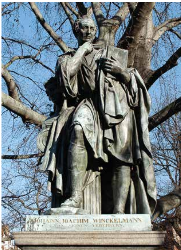
Abb. 4: Johann Joachim Winckelmann, Bronzestatue von Ludwig Wichmann, Stendal, Winckelmann-Platz

Илл. 4: Иоганн Иоахим Винкельман, бронзовая статуя работы Людвиг Вихмана, Стендаль, площадь Винкельмана