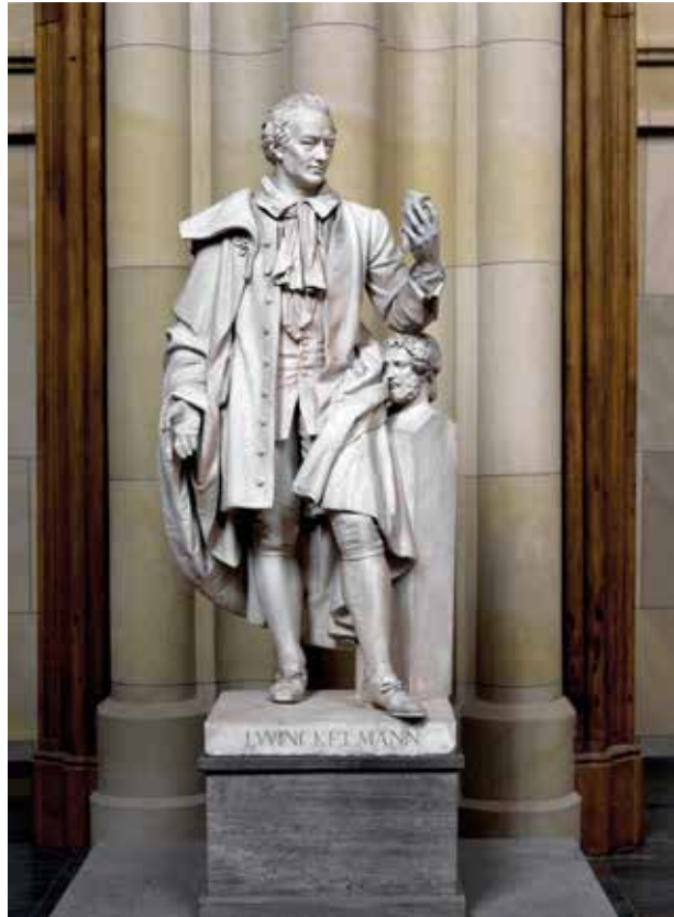
Abb. 5: Johann Joachim Winckelmann, Marmorstatue von Ludwig Wichmann, Berlin, ehem. in der Vorhalle des Alten Museums, Staatliche Museen zu Berlin, Nationalgalerie

Zurück zu den Winckelmann-Statuen: Es gibt noch eine vierte, später entstandene lebensgroße Skulptur,