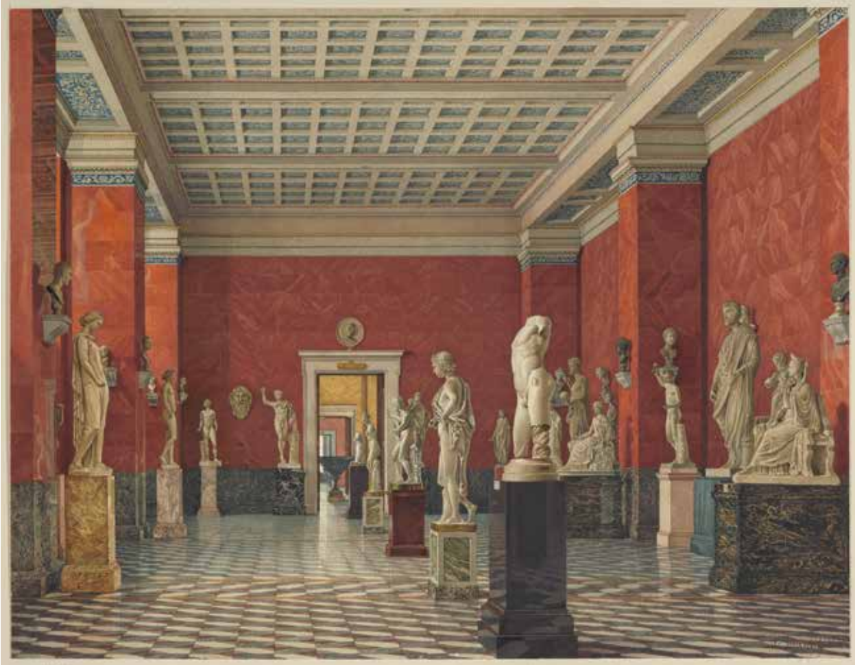
Abb. 8: Konstantin Uchtomskij, Innenraum der Neuen Ermitage, Saal der antiken griechischen Skulpturen, Aquarell 1853, Staatliches Ermitage Museum, St. Petersburg

Илл. 8: Константин Ухтомский, интерьер Нового Эрмитажа, зал древнегреческой скульптуры, акварель, 1853, Государственный Эрмитаж, Санкт-Петербург