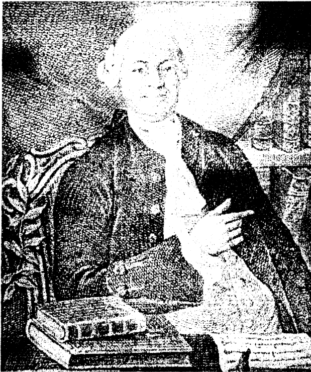
Василий Кириллович Тредиаковский (1703–1768)