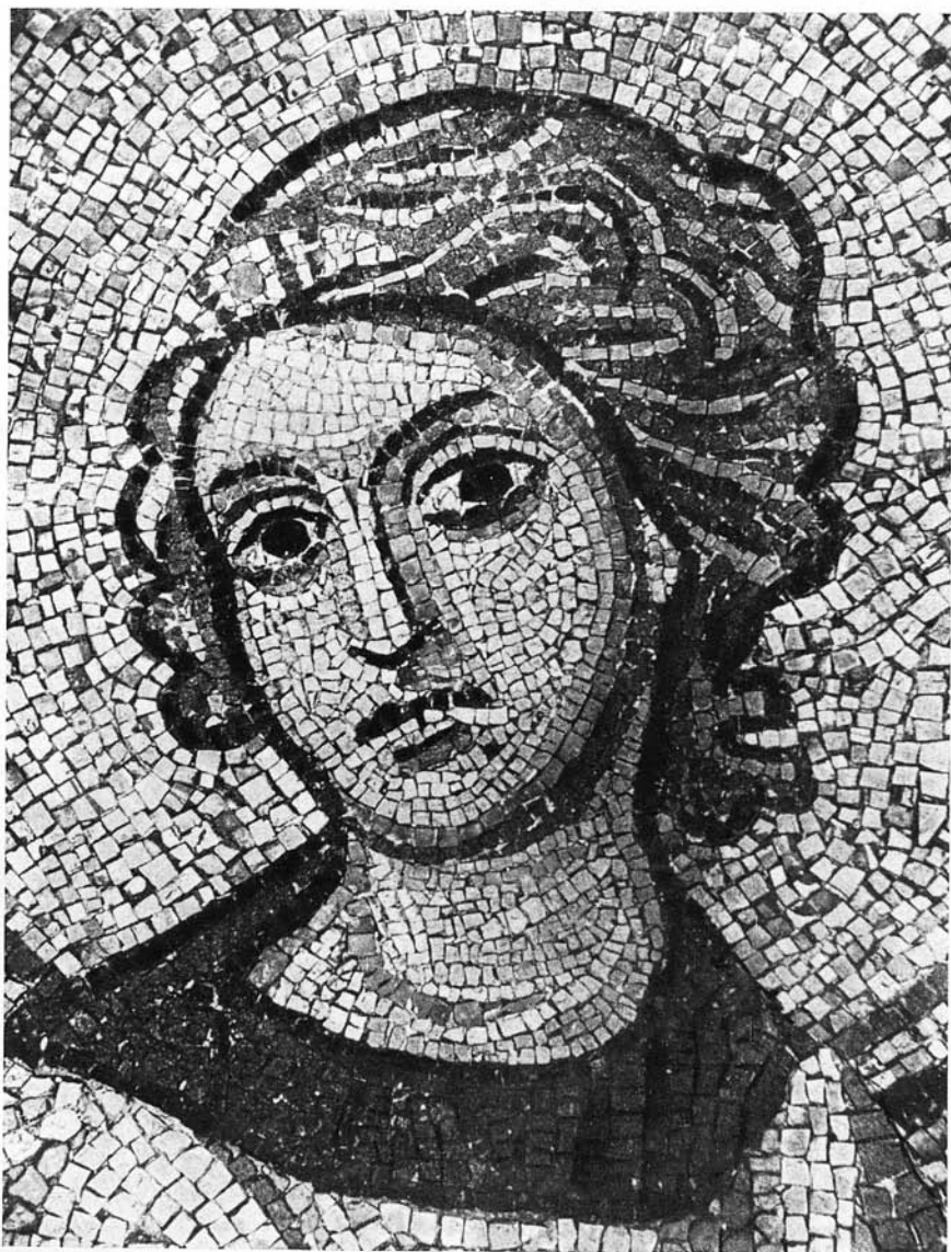
Рис. 2. Ангел. Деталь мозаики XII в., бывшей в алтаре церкви Михайловского монастыря в Киеве. Теперь в Софийском соборе в Киеве.