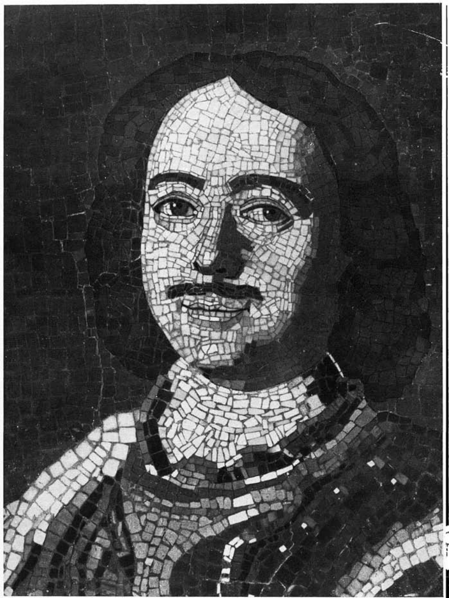
Рис. 1. Петр I. Деталь мозаичного портрета работы М. В. Ломоносова 1754 г. Государственный Эрмитаж.