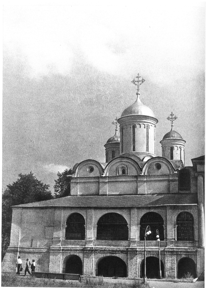
Спасо-Преображенский собор Спасо-Ярославского монастыря.